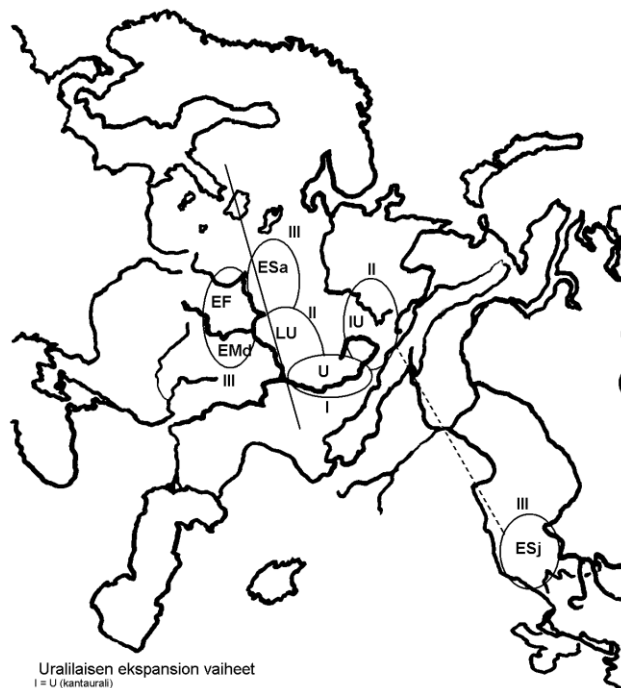
Uralilaisen ekspansioon vaiheet I = U (kantaaurali) II = LU (länsiurali), IU (itäurali), U (keskiurali) III = Esa (esisaaime), EF (esi-itämerensuomi), EMD (esimordva), Esj (esisamojedi), U (esimani, esipermi), IU (esiunkari, esimansi, esihanti) Suora viiva = lehtimetsävyöhykkeen pohjoisraja nykyään

Missä itäuralilaista murretta sitten on puhuttu? Kantasamojedin puhuma-alue paikannetaan Sajanin pohjoispuolelle, kun taas mansia ja ilmeisesti hantiakin on aiemmin puhuttu myös Uralin länsipuolella. Kantaauralin itämurretta lieneekin puhuttu vielä Kaman ja Uralin alueella. Uusien ajoitusten mukaan kantaauralin vaihe olisi jatkunut vuoden 2000 eaa. tienoille saakka, minkä jälkeen olisi alkanut itäuralilaisten muutosten kausi, ja esisamojedin leviäminen/siirtyminen kauas kaakkoon olisi tapahtunut vasta tämän jälkeen. Ajan, paikan ja leviämissuunnan osalta sopiva arkeologinen vastine olisi Seiman-Turbinon pronssikauppaverkosto: Turbinon keskus osuu itäuralilaisen murteen alueelle ja Länsi-Sajanin vähäisempi keskus kantasamojedilaiselle alueelle. 1